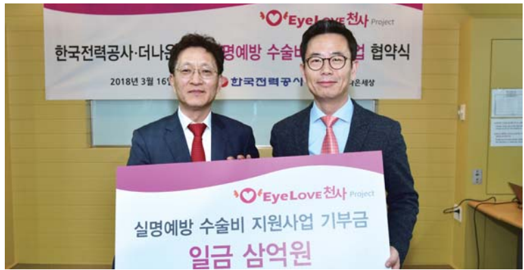
한전, 실명위기 환자에 '세상의 빛' 선물 취약계층 실명예방 행복한 사회발전 기여

최씨는 "장학생으로 선발될 수 있도록 도움을 준 교수님과 학과 선배들에게 감사드린다"며 "한의학의 세계화에 기여할 수 있는 한의사가 되도록 노력하겠다"고 말했다. /황애란 기자