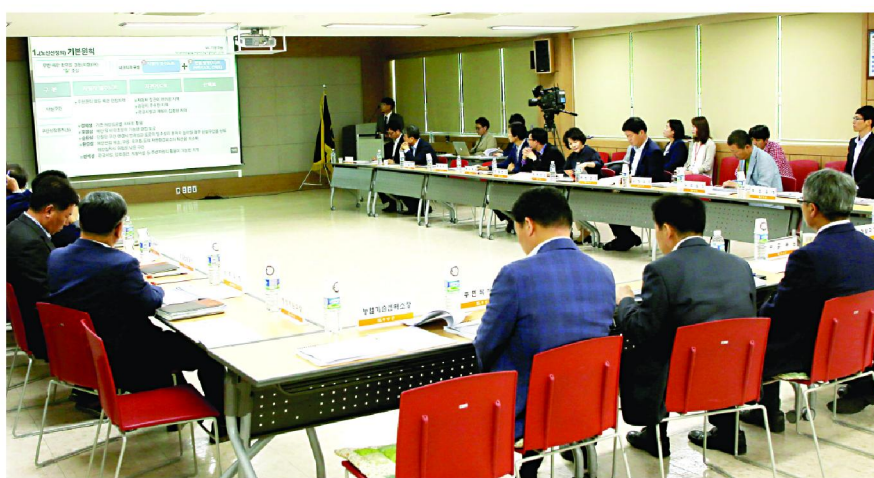
무안군은 최근 군정 회의실에서 해안관광일주도로 개발계획 수립용역 중간보고회를 개최했다.

기본원칙은 무안군 해안전역을 보고 체험할 수 있는 '길' 조성이다. 이와 관련 경제성과 조망성, 순환성과 환경성, 연계성