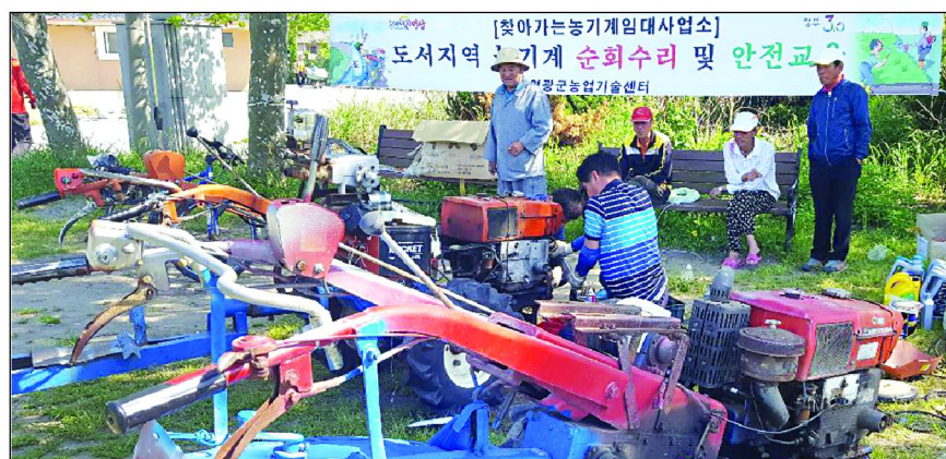
영광군은 최근 송이도와 안마도에서 농기계 순회수리 및 안전교육을 실시했다.