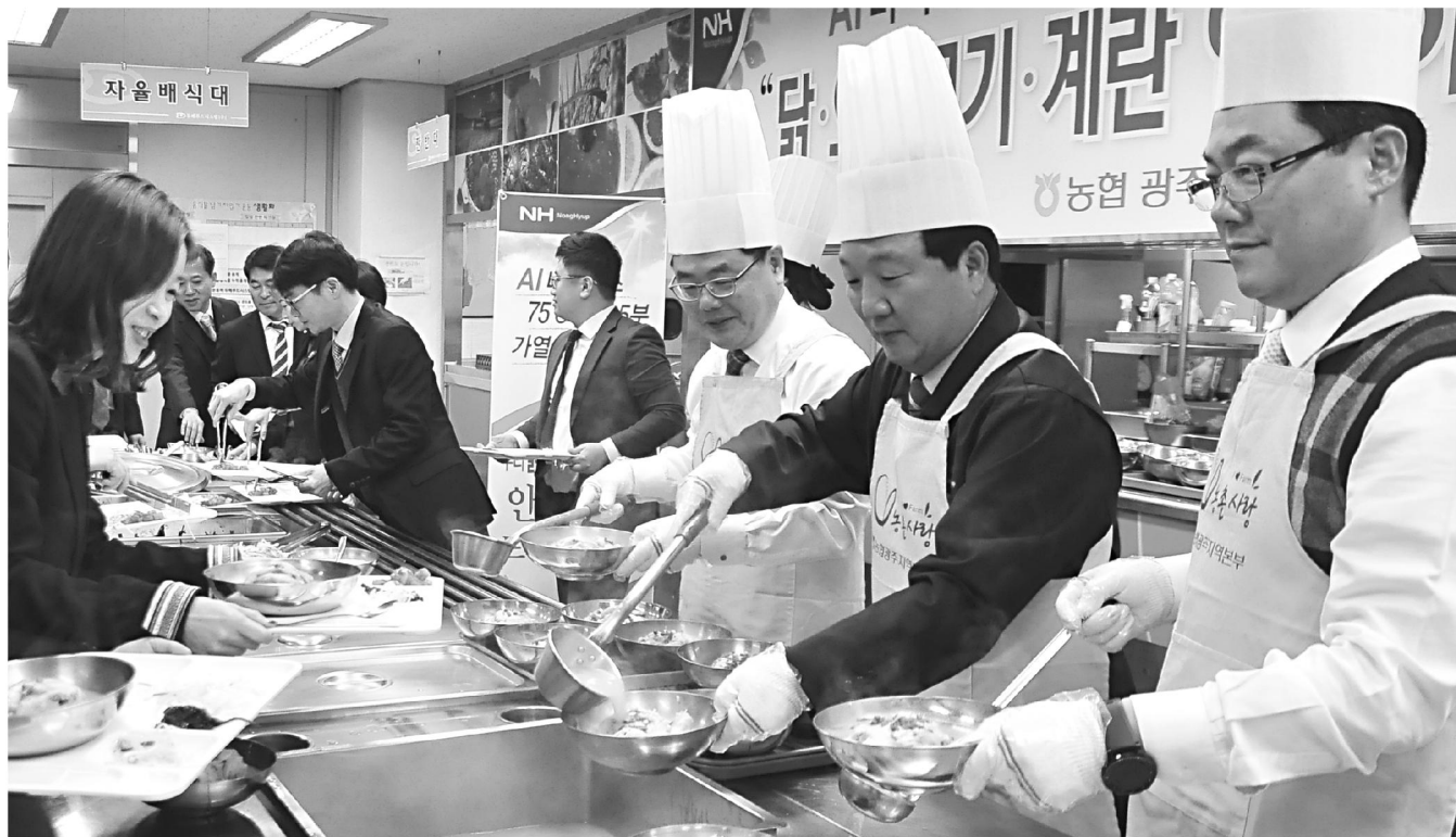
농협광주본부, 닭고기 소비촉진 시사회 농협광주본부는 26일 지역본부 구내식당에서 범농협 임직원들과 함께 삼계탕 시사회를 가졌다.

이번 상담원 모집은 서류전형을 거쳐 내년 1월 4일 개별봉투시험 합격자는 건강검진 및 면접 후 최종 선발된다. 서류는 오는 12월 30일까지 이메일 접수한다.